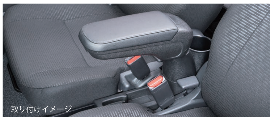
取り付けイメージ